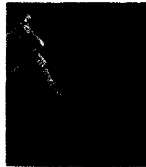
Yarns and Fabrics

We, the LNJ Bhilwara Group, are a multi-product Group with interests in diverse fields. With over three decades of experience, production units spread across the country at 19 locations and the prestigious ISO 9002 certification for five of our Group companies, quality comes to us naturally !