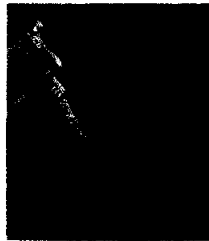
Yarns and Fabrics

We, the LNJ Bhilwara Group, are a multi-product Group with interests in diverse fields. With over three decades of experience, production units spread across the country at 19 locations and the prestigious ISO 9002 certification for five of our Group companies, quality comes to us naturally !