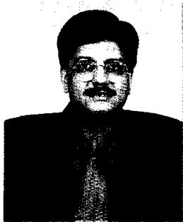
श्री पीयूष गोयल Shri Piyush Goyal