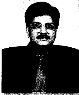
श्री पीयूष गोयल Shri Piyush Goyal