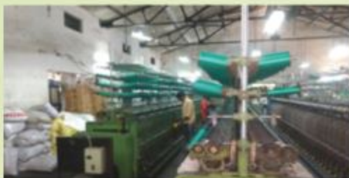
मेसर्स गोवावेर फिलामेंट्स को पोंडा शाखा गोवावेर फिश नेट बनाने के लिए कार्यशील पूंजी का वित्तपोषण Ponda Branch, Goa financed Working Capital Loan to M/s. Goaware Filaments for manufacturing of fish net.