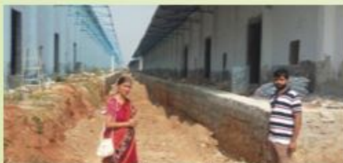
मेडचल शाखा द्वारा मेसर्स लक्ष्मी नरसिम्हा वेयर हाउसिंग कॉर्पोरेशन को ग्रामीण गेददम हेतु वित्तपोषण Medchal Branch, Telangana financed M/s. Lakshmi Narasimha Ware Housing Corporation for Rural Godowns.