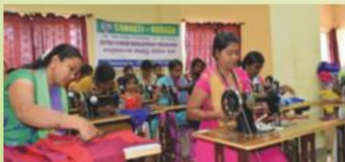
बैंक द्वारा कुडिगे में स्थापित कॉर्पोरेशन बैंक स्वरोज्जाय संस्थान ( कोबसेटी ) में जारी एक सितारा प्रशिक्षण कार्यक्रम A Training programme in progress at the Corporation Bank Self Employment Training Institute (COBSETI) in Kudige, Karnataka.