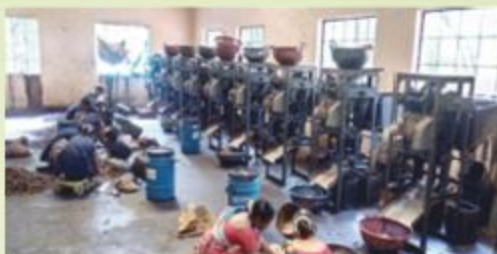
बिचोलिम शाखा, गोवा द्वारा मेसर्स प्रवीण कैशू इंडस्ट्री को फार्म प्रोसेसिंग के लिए टर्म लोन तथा वर्किंग कैपिटल का वित्तपोषण Bicholim Branch, Goa financed a Term Loan and a Working Capital Loan to M/s. Pravin Cashew Industry for Cashew Processing.