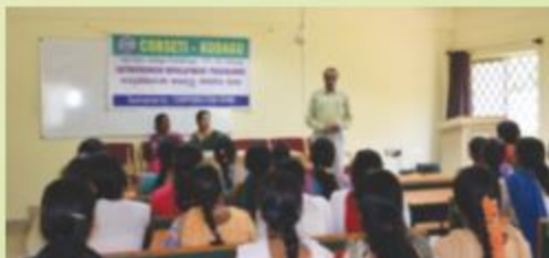
कुडिगे में बैंक द्वारा स्थापित कॉर्पोरेशन बैंक स्वरोज्जाय प्रशिक्षण संस्थान में इंटरप्रेन्योरशिप विकास कार्यक्रम का आयोजन Entrepreneurship Development Programme conducted by the Corporation Bank Self Employment Training Institute (COBSETI) in Kudige, Karnataka.