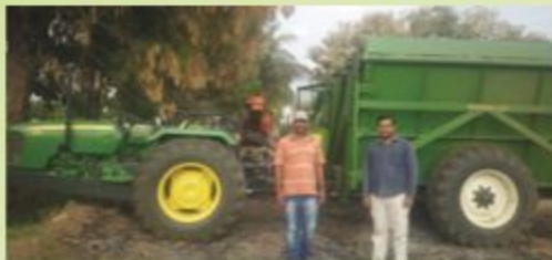
मुदेबिहाल शाखा, कर्नाटक द्वारा सीकेएफएम योजना के अंतर्गत नक्का हार्वेस्टर तथा ट्रॉली का वित्तपोषण Muddebihal branch, Karnataka financed a Sugarcane Harvester and a Trolley under CKFM Scheme.