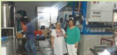
पंचकुला शाखा, चंडीगढ़ द्वारा स्टैंड अप इंडिया योजना के अंतर्गत आरएसजी एक्वा सॉल्यूशंस को वित्तपोषण Panchkula Branch, Chandigarh financed M/s RSG AQUA SOLUTIONS under Stand Up India Scheme.