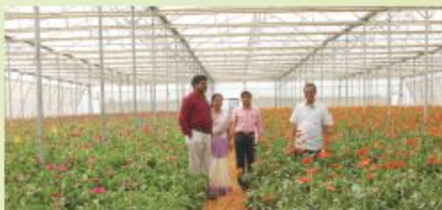
सिकंदराबाद शाखा द्वारा गेरबेरा की खेती के लिए ग्रीनहाउस का वित्तपोषण Secunderabad Branch, Telangana financed a Gerberas growing Greenhouse unit.