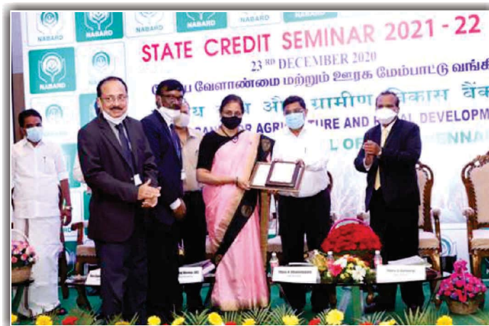
Indian Bank bags 1 st position among Public Sector Banks for Self Help Group (SHG) - Bank Linkage Programme for the year 2019-20 in Tamil Nadu.