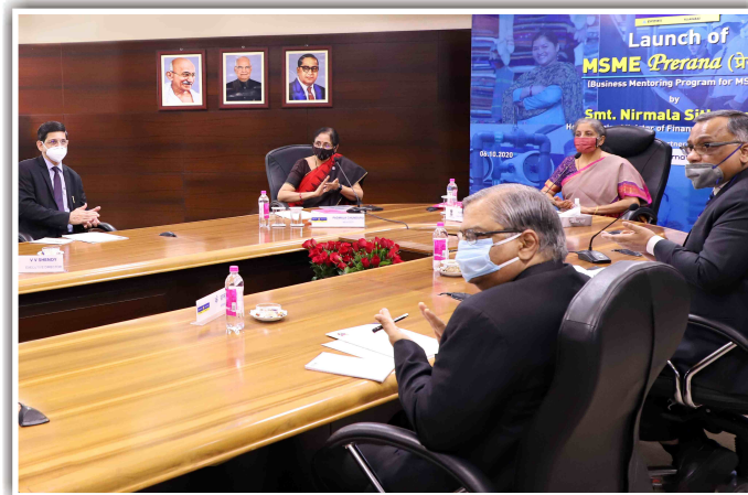
Hon'ble Finance Minister, Smt. Nirmala Sitharaman launches Indian Bank's 'MSME Prerana', a Business Mentoring Programme in vernacular for MSMEs