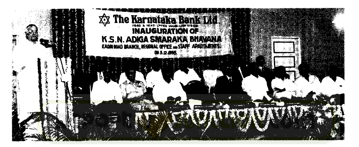
Sri.B.A. Moideen, Minister for Small Scale Industries, Govt. of Karnataka, speaking at the formal function on the above occasion.