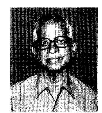
www.reportjunction.cor M. R. Mayya