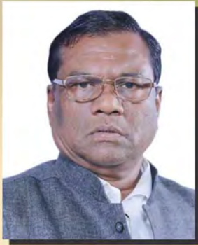
श्री फगगन सिंह कुलस्ते माननीय इस्पात एवं ग्रामीण विकास राज्य मंत्री Shri Fagga Singh Kulaste Hon'ble Minister of State for Steel & Rural Development