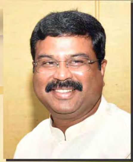
श्री धर्मेंद्र प्रधान माननीय केंद्रीय मंत्री - पेट्रोलियम एवं प्राकृतिक गैस मंत्रालय, इस्पात मंत्रालय (06.07.2021 तक) Shri Dharmendra Pradhan Hon'ble Minister of Petroleum & Natural Gas & Minister of Steel (upto 06.07.2021)