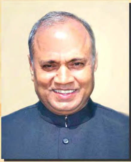
श्री राम चंद्र प्रसाद सिंह माननीय केंद्रीय इस्पात मंत्री (07.07.2021 से प्रभावी) Shri Ram Chandra Prasad Singh Hon'ble Minister of Steel (w.e.f. 07.07.2021)