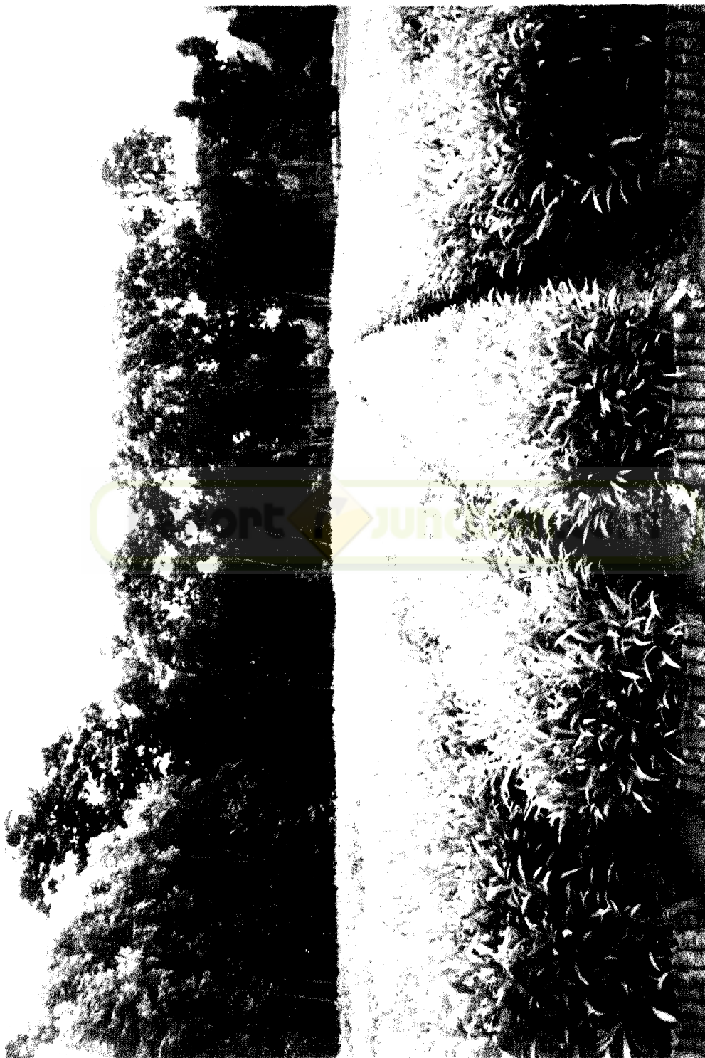
Leucaena curatiformis nursery