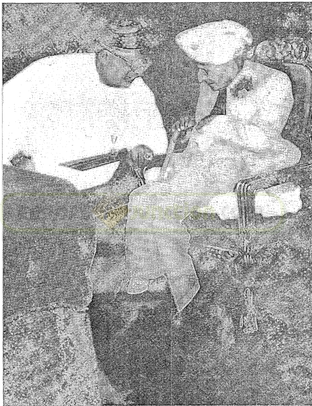
THE GREAT STALWARTS