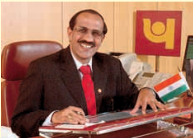
के.आर. कामत K. R. Kamath