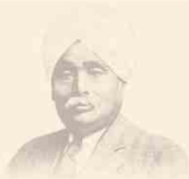
लाला लाजपत राय Lala Lajpat Rai