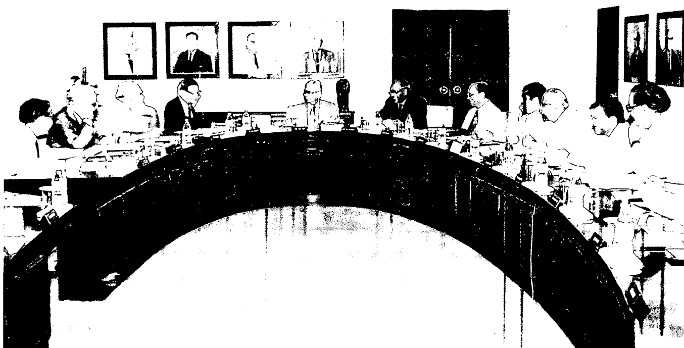
निदेशक मण्डल की सभा के दृश्य View of the meeting of the Board of Directors