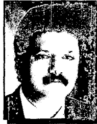
श्री अजय जी पीरमल Shri Ajay G. Piramal