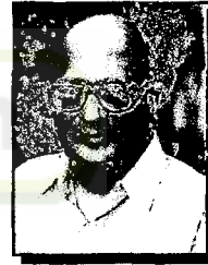
डा. आई. जी. पटेल Dr. I. G. Patel