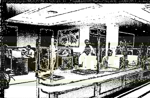
कारपोरेट लेखा समूह शाखा कलकत्ता का आंतरिक दृश्य Inside view of CAG Branch, Calcutta