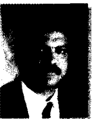
श्री अजय जी. पीरामल Shri Ajay G. Piramal