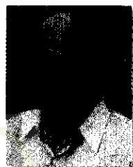
डा. आई. जी. पटेल Dr. I. G. Patel