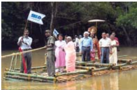
Reaching out to the remotest areas Donation of 2 rafts to Kuruva Community in Wyanad by the Bank's Sulthan Bathery Branch

घरेलू वित्तीय प्रणाली का लचीलापन एवं स्थिरता देश के अपने समष्टि-आर्थिक स्थिरता के लिए विशेषकर तेजी से एकीकृत हो रहे विश्व में अनिवार्य है। भारतीय बैंक उप-आध्य संकट की चरमसीमा के दौरान और अनुवर्ती वित्तीय विक्षोभ के दौरान भी लचीले बने रहे। बैंकिंग क्षेत्र पर्याप्त रूप से पूँजीकृत है। बेसल II में स्थानांतरित होने के परिणामस्वरूप, बैंकिंग प्रणाली के पूँजी पर्याप्तता अनुपात में वृद्धि हुई। कुल जमाओं में कम लागत के चालू और बचत खाता जमाराशियाँ का अपेक्षाकृत उच्च अंश और जोखिम मुक्त सरकारी प्रतिभूतियों में एस एल आर पूर्वक्रम अधिकार, नकदी एवं शोध-क्षमता मामलों का ध्यान रखते हैं। देखा गया है कि सार्वजनिक क्षेत्र के बैंक, विस्तारित ऋण में वृद्धि के मामले में, निजी बैंकों में कमी और विदेशी बैंकों के कारोबार में गिरावट की तुलना में बेहतर काम कर रहे हैं। आर्थिक मंदी से बैंकिंग प्रणाली के तुलन पत्र की वृद्धि में गिरावट आ गई। इसका बैंकों की ऋण गुणवत्ता और लाभप्रदता पर विलंबकारी प्रभाव पड़ सकता है। विनियामक परिवर्तनों ने भी वित्तीय अन्तर्वेशन, मोबाईल बैंकिंग और ग्रामीण बैंकिंग जैसे क्षेत्रों में नये अवसरों के द्वार खोल दिये हैं। ऐसे कुछ मामले जिनसे आने वाले समय में बैंकर व्यस्त रहने का अनुमान है उनमें नकदी प्रबंधन, निधियों का लाभकारी अभिनियोजन, कम आवादी वाले बैंक