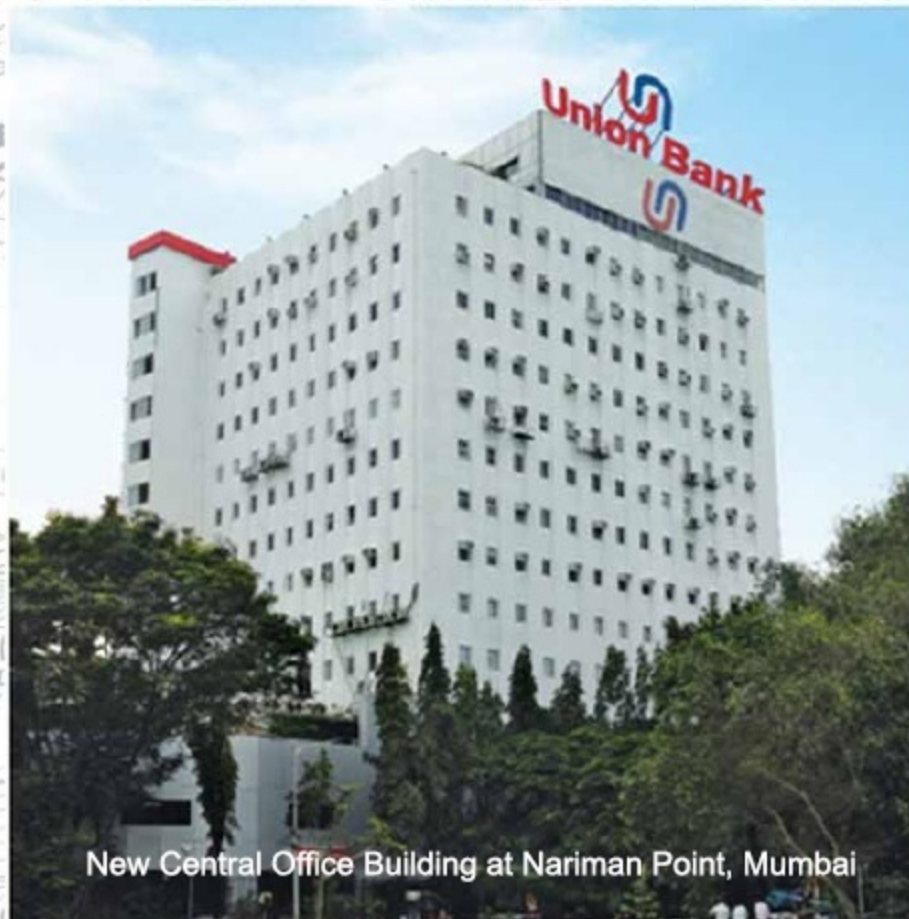
New Central Office Building at Nariman Point, Mumbai