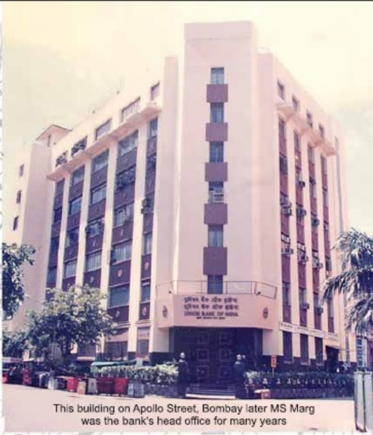
This building on Apollo Street, Bombay later MS Marg was the bank's head office for many years

Over the years, Union Bank continued its growth pattern, expanding to newer markets, reaching out to newer sectors and building its network.